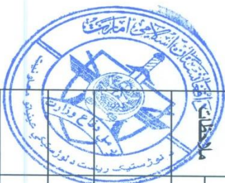
جدول سبایت های اکیالاتی یک قلم گاز مایع طبخ اعاشه ضرورت قطعات و جزو تام های مرکزی از بابت شش ماه ارسال مالی 1401

تهیه و تدارک یک قلم گاز مایع طبخ اعاشه ضرورت قطعات و جزو تام های مرکزی و قول اردوهای ساحوی از بابت شش ماه سال مالی ۱۴۰۱