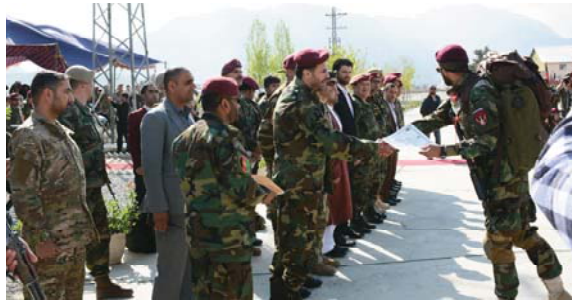
عده یی از افسران، بریدمندان و سربازان خروتامهای قبول اردوی یاد بود، با تلاوت آیات چند ازکلام الله

به کمیت (۲۷۱) تن از افسران بریدمندان و سربازان خروتامهای مختلف اردوی ملی بعد از فراگیری آموزشهای مسلک کماندو از دوره بیست و هفتم تعلیمات کماندو فارغ وطی محفل با شکوه که در گرانزیبون ریشتور تدویر یافته بود سند فراغت شائرا بدست آوردند. مراسم که به همین مناسبت به اشتراک اسدالله «خالد» سرپرست وزارت دفاع ملی، دگرجنرال بسم الله «وزیری» لوی درستیز قوای مسلح، ژنوبرجنرال محمد حیدر «نیکویی» سرپرست قول اردوی عملیات خاص کماندو، جنرالان، افسران قرارگاه قول اردو، مسوولین نهادهای جامعه مدنی،