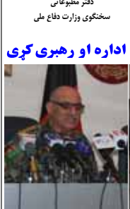
دو ساله بود لوی درستی: ملی اردو دا خواگمندی لری چې جگره ایز فعالیتونه پخبله بلان، سوق، اداره او رهبری کری