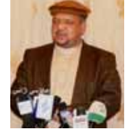
باشه شهادت پروفیسور برهان الدین ربانی عالی صلح و ستر جنرال عبدالرحیم وردک وزیر دفاع ملی حادثه تروریستی را که