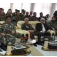
عده از منسوبان اردوی ملی که جهت اشتراک در جشن ملی کشور تاجکستان عازم آن کشور گردیده بودند از بدست آوردن مدال ها و افتخارات بویون پرگشته و مورد تقدیر مقامات محترم وزارت دفاع ملی و ستر در سبزه قرار گرفتند