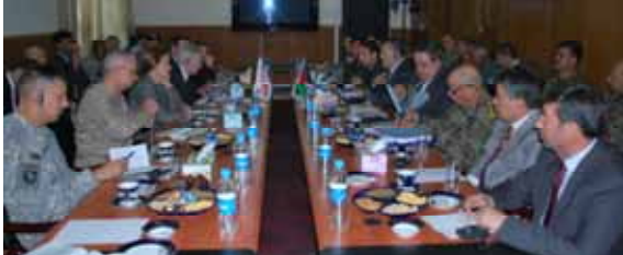
ملاقات نمودند. در این ملاقات بحث روی الکتشاف قوای انیشتی افغان، چالش های سد راه پروسه انتقال امنیت، تسریع تعلیم و تربیه اردوی

ملی، بررسی وضعیت منطقه و همکاری های منطقه ای در محراق صحبت های جانبین قرار داشت. متعاقباً وزیر دفاع ملی و وزیر امور خارجه کشور پروسه انتقال را برای تأمین حاکمیت ملی مفید دانسته و از موفقیت های که در این راه حاصل شده اطمینان دادند. سپس معاون وزیر دفاع امریکا همکاری دوامدار کشورش را در عرصه های سیاسی، نظامی و اقتصادی ابراز نموده و اطمینان داد که ایالات متحده امریکا افغان ها را در این راستا تنها نخواهد گذاشت.