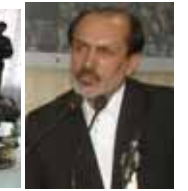
عده از منسوبان اردوی ملی که جهت اشتراک در جشن ملی کشور تاجکستان عازم آن کشور گردیده بودند از بدست آوردن مدال ها و افتخارات بویون پرگشته و مورد تقدیر مقامات محترم وزارت دفاع ملی و ستر در سبزه قرار گرفتند