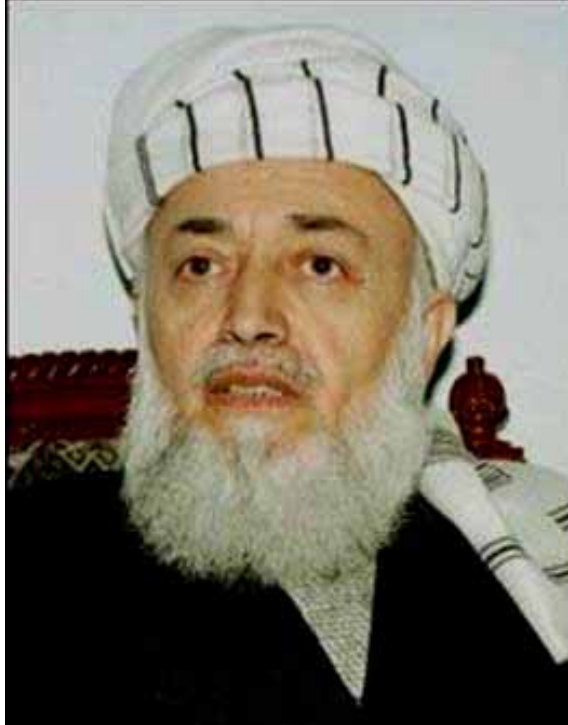
شاد روان استاد برهان الدین ربانی که روز سه شنبه (۲۰ سپتامبر ۲۹ سنبله) در قریض آباد ولایت بدخشان بدنیا آمده و مکتب در در زادگاه خود، ولایت

رئیس جمهوری بدنبال سالها جنگ علیه دولت وقت، گروه های مجاهدین در رهبری استاد ربانی در سال ۱۳۷۱ وارد کابل شدند. برای دو ماه صیحت الله مجددی ریاست دوره موقت دولت مجاهدین را بر عهده داشت بعداً رسماً استاد ربانی اولین رئیس دولت