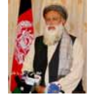
باشه شهادت پروفیسور برهان الدین ربانی عالی صلح و ستر جنرال عبدالرحیم وردک وزیر دفاع ملی ساعت ده شب در قصر شورای وزیران در برابر خبرنگاران قرار گرفته مراتب تسلیت ۳