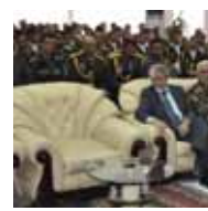
عده از منسوبان اردوی ملی که جهت اشتراک در جشن ملی کشور تاجکستان عازم آن کشور گردیده بودند از بدست آوردن مدال ها و افتخارات بویون پرگشته و مورد تقدیر مقامات محترم وزارت دفاع ملی و ستر در سبزه قرار گرفتند