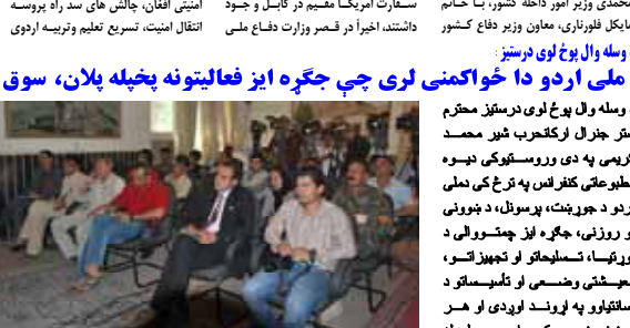
دو ساله بود لوی درستی: ملی اردو دا خواگمندی لری چې جگره ایز فعالیتونه پخبله بلان، سوق، اداره او رهبری کری