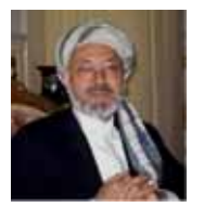
بسم الله الرحمن الرحيم المؤمن رجال صدقوا ما عاهدوا الله عليه فمنهم من قضی نحبه ومنهم من ينتظر وما بدلوا تبديلا. با کمال تأسف و تأثر عمیق که برهان الدین ربانی رئیس پیشین دولت جمهوری اسلامی افغانستان و یکی از رهبران ارشد جهاد و مقاومت و رئیس شورای عالی صلح افغانستان و چند تن از همراهانش بر اثر حمله تروریستی به شهادت رسید. استاد برهان الدین ربانی یکی از رهبران و شخصیت های بزرگ سیاسی در کشور بود