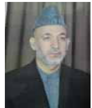
محترم حامد کزوی رئیس جمهوری اسلامی افغانستان حمله تروریستی را که منجر به شهادت پروفیسور برهان الدین ربانی رئیس جمهور سابق افغانستان و رئیس شورای عالی صلح گردید به شدید ترین الفاظ محکوم کرد. به اساس معلومات دفتر مطبوعاتی ریاست جمهوری به ازاس اطلاعاتی باختر، حامد کزوی رئیس جمهوری اسلامی افغانستان که جهت اشتراک در اجلاس مجمع عمومی سازمان ملل متحد که در شب به نیویارک رسید با آقای از حمله تروریستی به جان پروفیسور برهان الدین ربانی و شهیدان موصوف سفرش را ناتمام گذاشت و بسوی کابل حرکت کرد. رئیس جمهوری قبل از حرکت به جانب