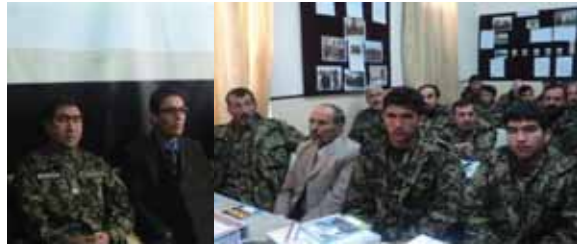
ستردرستیز، معاونین و مفتشین اردوی ملی و پولیس ملی و همکاران بین المللی اشتراک نموده بودند. سرمفتش وزارت دفاع ملی تدویر چنین برنامه های آموزشی را جهت ارتقای

ظرفیت های مسلکی اکتشاف و توانمندی های نیروهای امنیت و آزاد عمل در وظیفه برای مفتشین در مبارزه با فساد اداری و ایجاد شفافیت و حسابداری یک گام مهم و ارزنده خوانند بعداً رئیس تفتیش ستردرستیز گفت: ما مسئولیت بزرگ را پیش رو داریم که برای بهبود بروسه شفافیت و حسابداری و پیشبرد وظایف کاری مفتشین از هیچ گونه سعی و تلاش دریغ ننماییم، تا مفتشین با جرئت و جسارت وظایف خویش را انجام دهند، که تدویر چنین کورس ها به خاطر کسب دانش مسلکی و ارتقای سطح دانش منسوبان تفتیش در پیشبرد امورات یک ضرورت جدی می باشد.