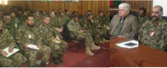
تالار کنفرانس های وزارت دفاع ملی تدویر یافته بود، برسد جنرال محمد اسمین «تصمیم» رئیس عقیدتی و فرهنگی ستردرستیز تدویر چنین سیمینار ها را به خاطر

رشد و تقویت مورال اردوی ملی مفید خواننده گفت: تروریزم پدیده سیاه و منفی است که ثبات و آرامش عمومی را به چالش می کشاند تأمین صلح و امنیت نیاز به ییکاز و مبارزه پیگیر با تروریزم دارد. پس شما منسوبان اردوی ملی منجبت مدافعان کشور مسئولیت دارید زمینه فضای صلح و آرامش را برای ملت خویش مساعد سازید و وظیفه ایسانی و وجدانی خود را نزد خداوند متعال و مردم